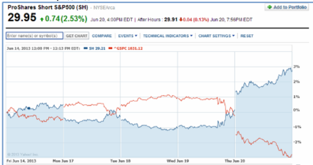
Рисунок 1. ProShares Short S&P500 (SH) vs S&P500

Например, фонд ProShares Short S&P500 (SH) - показывает доходность обратно пропорциональную доходности индекса SP500. То есть если индекс упадет на 1%, то фонд покажет положительную доходность на тот же 1%.